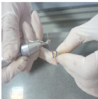
شکل ۱ - برش دندانها توسط اره الماسی از لبه اینسیزال (برش‌ها موازی با لبه اینسیزال)

گروه اول: ۱۰ دندان توسط اره الماسی با سرعت پایین (Top Dent و Swiss mode) همراه با خنک‌کننده آب عمود بر محور طولی دندان طوری برش داده شدند که لبه اینسیزال ۳ میلی‌متر کوتاه گردید و خط برش موازی با لبه اینسیزال بود (شکل ۱)