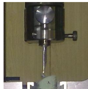
شکل ۳- نمونه تحت نیروی فشاری دستگاه Zwick با زاویه ۱۳۵

عمق ۱ میلی‌متر در تمام طول مزیدستال دندان به صورت افقی در ترمیم کامپوزیتی در محلی ۲ میلی‌متر پایین‌تر از لبه اینسیزال ایجاد گردید و در نهایت نمونه‌ها را در جیگ دستگاه ثابت کردیم و آنها را تحت نیروی فشاری دستگاه (Germany, Zwick, Z20) با سرعت ۱ میلی‌متر در دقیقه (۷) قرار داده به طوریکه دندان در شیار پالاتالی خود تحت زاویه ۱۳۵ درجه (۷) (۱۲) به وسیله تیغه‌ای که عرض MD آن از عرض مزیدستال دندان بیشتر است تحت تأثیر نیرو قرار گرفتند تا بشکند (شکل ۳).