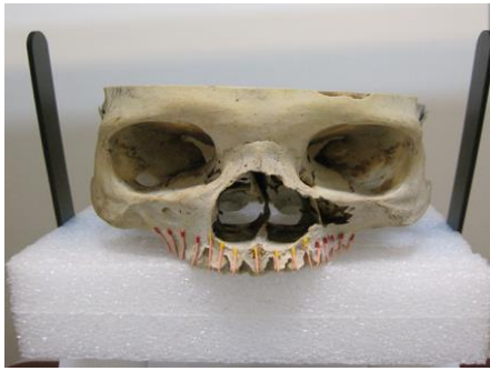
شکل ۱- نمونه علامت گذاری شده با گوتا پرکا

یکبار توموگرافی CBCT توسط دستگاه Scanora 3Dx ساخت کارخانه Sordex فنلاند و بار دیگر رادیوگرافی پانورامیک دیجیتال توسط دستگاه Cranex D ساخت کارخانه Sordex فنلاند انجام گرفت. تکنیک رادیوگرافی پانورامیک دیجیتال با پارامترهای اکسپوژر S16 و mA10 و kV60 و CBCT با پارامترهای اکسپوژر S8 و mA15 و kV85 انتخاب شد. ضریب بزرگنمایی هر ۲ دستگاه با توجه به مقدار تعیین شده توسط کارخانه سازنده یک به یک در نظر گرفته شد، سپس فاصله کور تکس کف سینوس ماگزایلا تا کرست آلوئول توسط سه نفر متخصص رادیولوژی دهان و فک و صورت در رادیوگرافی پانورامیک دیجیتال توسط برنامه نرم افزاری