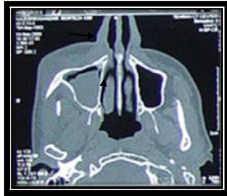
شکل ۴- نمای CT scan، توده ای در سینوس ماگزیل سمت راست مشاهده می گردد.

پاپیلومای معکوس شایع ترین فرم پاپیلومای سینونزال می باشد که پتانسیل بسیار زیادی برای تهاجم موضعی و تغییرات بدخیمی دارد. در موارد علامت دار ضایعه با انسداد یکطرفه بینی خود را نشان می دهد و در سایر موارد کاملاً بدون علامت است (۸) . میزان عود حدود ۹٪ و میزان تغییرات بدخیمی ۷٪ و میزان مرگ و میر بیماران در ۳ سال حدود ۴۰٪ گزارش شده است (۹ و ۵) . به دلیل احتمال مرگ و میر ناشی از بیماری معاینه و فالوپ بیماران خصوصاً از راه بررسیهای اندوسکوپیک بعد از تایید تشخیص لازم می باشد (۷) . بخشایی و همکارانش مورد مشابهی از پاپیلومای معکوس را گزارش کرده اند (۱) . همچنین میرزا و همکاران جراحی و برداشت کامل ضایعه همراه با پیگیری طولانی مدت جهت تشخیص عود مجدد ضایعه را پیشنهاد کرده اند (۹) . مطالعات جدید ارتباط افزایش بروز مارکرهایی همچون Survivin، Fascin و Desmogelin را با بروز تغییرات بدخیمی در پاپیلوماهای سینونزال مطرح می کنند (۱۲ و ۱۱) که مطالعه ما از نظر بررسی ایمنو هیستوشیمیایی این نشانگر محدودیت داشت. در مورد قدرت تشخیصی MRI در افتراق موارد با احتمال بالاتر بروز تغییرات بدخیمی از سایر موارد اختلاف نظر وجود دارد (۱)