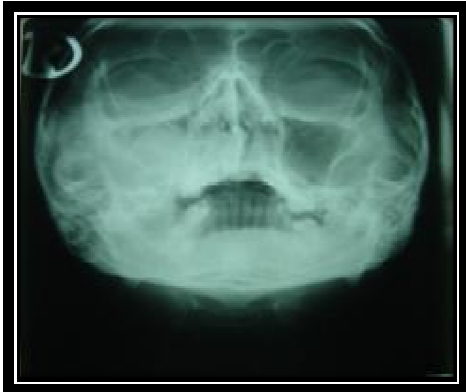
شکل ۲- نمای رادیوگرافی واترز، توده ای در سینوس سمت راست ماگزایلا مشاهده می گردد.

درگیری ارگانهای دیگر را نشان نداد. در نمای رادیوگرافی واترز توده ای در سینوس سمت راست دیده می شد. تصاویر CT Scan و رادیوگرافی واترز توده ای را در سینوس با درگیری استخوان کورتیکال باکال و پرفوریشن آن نشان می داد که شبیه به ضایعات بدخیم بود (شکل ۲ و ۳). می شود.