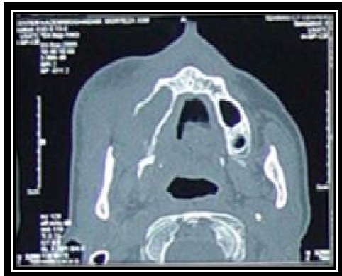
شکل ۳- نمای CT scan، پرفوریشن دیواره باکال سمت راست مشاهده می گردد.

چشم و سینوس سمت مقابل دست نخورده به نظر می رسید و انحراف سپتوم بینی به سمت چپ دیده می شد. بررسی CTscan توده ای هموزن را در سینوس سمت راست با ادم بافت های نرم ناحیه شبیه به انفیلتره تومورال نشان می داد (شکل ۴).