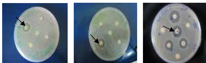
شکل ۲- تاثیر مواد آنتی باکتری مختلف بر روی استرپتوکوکوس سنگوئیس فلش: هاله عدم رشد a: آموکسی سیلین b: سیاه دانه c: نانوسیلور

در مورد باکتری استرپتوکوکوس سنگوئیس، بیشترین میزان هاله عدم رشد مربوط به آموکسی سیلین و به میزان ۱۹/۷۵±۰/۳۵ میلیمتر و بعد از آن نانوسیلور به میزان ۱۵/۵±۰/۷ میلی متر و در مرتبه بعد روغن سیاه دانه با هاله ۱۱±۱/۴ میلی متر قرار داشت. (شکل ۲)