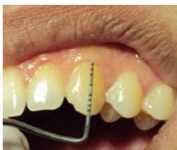
شکل ۳- لثه ضخیم

ضخامت لثه مارژینال توسط پروب ویلیامز و مشاهده سایه پروب صورت گرفت. بدین صورت که پروب در ناحیه مید باکال دندان مورد نظر وارد سالکوس لثه شد و اگر سایه پروب از روی لثه دیده می‌شد لثه نازک (شکل ۲) و اگر دیده نمی‌شد لثه ضخیم (شکل ۳) بود. (۱۵)