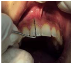
شکل ۱- اندازه گیری میزان لثه کراتینیز

اندازه‌گیری میزان لثه کراتینیزه توسط پروب ویلیامز از لثه مارژینال تا خط مخاطی لثه ای (Mucogingival Junction (MGJ) انجام پذیرفت. (شکل ۱)