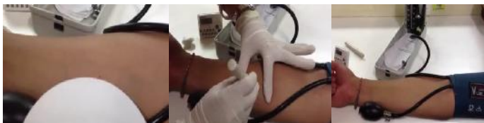
شکل ۱- مراحل اندازه گیری زمان سیلان به روش IVY (۱ تا ۳)

گیری نشود در صورت وجود مشکلات انعقادی و مصرف داروهای ضد انعقادی خونریزی شدید و طولانی مدت و به دنبال آن مشکلات وخیم تر و جدی تری به وجود می آید. خونریزی زیاد می تواند منجر به آنمی و افت شدید فشار خون، کاهش حجم خون و شوک هیپوولمیک و نیاز به تزریق سرم یا خون شود. (۶) در تحقیقات قبلی کاستی هایی وجود داشته از جمله اینکه محققین فقط یک عامل را در اندازه گیری نشان دخیل می دانستند در صورتی که مدت زمان خونریزی (BT) چند عاملی است و به عوامل متعددی بستگی دارد. (۳،۶) بعضی از تحقیقات قطع آسپرین را به مدت یک هفته توصیه می کنند. (۷) و بعضی نیازی به قطع آن نمی دانند و در رابطه با وارفارین بعضی قطع وارفارین را ۳ روز قبل از عمل جراحی توصیه می کنند و بعضی تا (INR=۳) را مجاز میدانند ولی تعدادی از جراحان عملاً با چنین INR ای دست به جراحی نمی زنند. (۸) از آنجاییکه در بیماران مراجعه کننده به مطب و out patient بررسی آزمایشگاهی در خصوص هموستاز معمولاً انجام نمی شود و تنها به سابقه پزشکی بیمار در خصوص مصرف آنتی ترومبوتیک ها و آنتی کوآگولان ها توجه می شود لذا آگاهی کافی از وضعیت هموستاز بیماران در مطب وجود ندارد. لذا برآن شدیم تا ارزیابی کنیم که آیا مدت زمان خونریزی ناشی از نفوذ لانست در مخاط دهان می تواند بیانگر مدت زمان خونریزی (سیلان) استاندارد باشد یا خیر؟