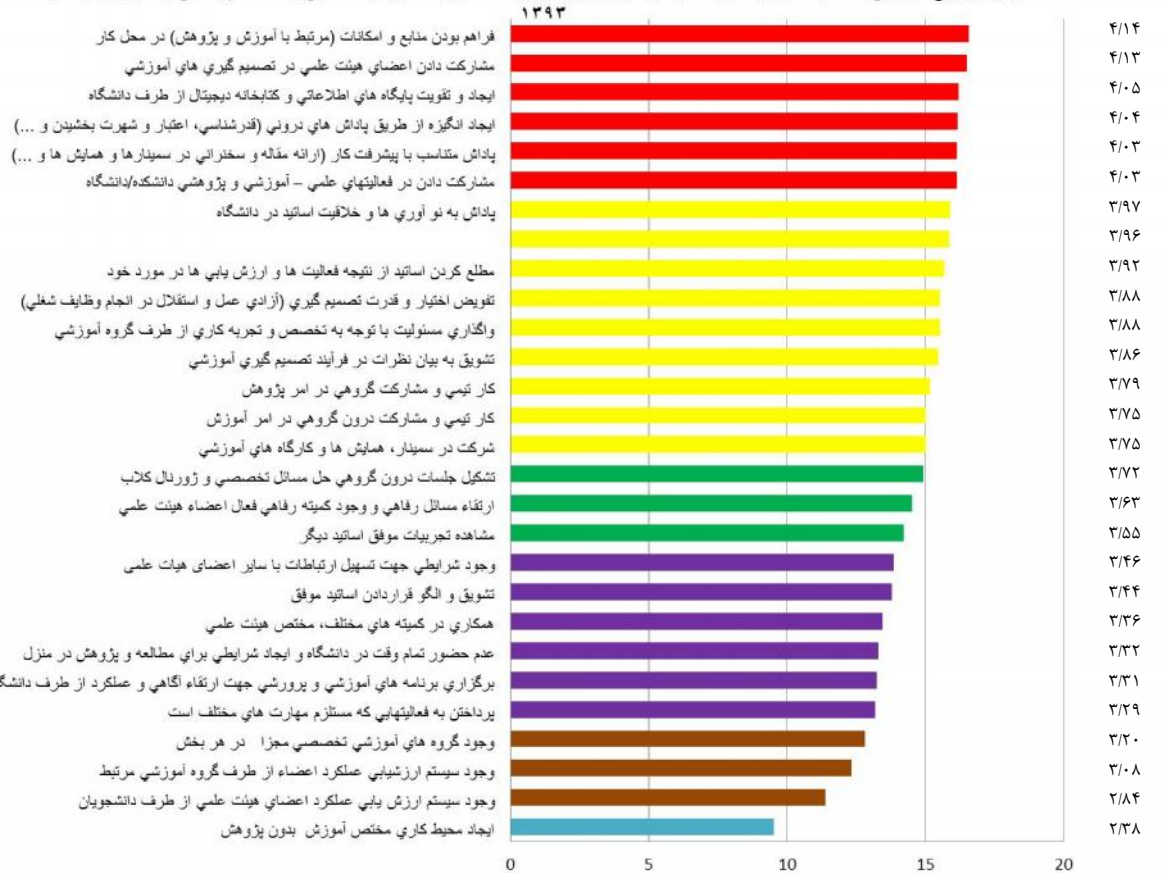
نمودار ۱: توزیع فراوانی به تفکیک اولویت، راهکارها و عوامل موثر بر توانمندسازی اعضای هیات علمی واحد دندانپزشکی آزاد تهران در سال ۱۳۹۳

گروه از اعضای هیات علمی برگزاری برنامه های آموزشی و پژوهشی جهت ارتقا آگاهی و عملکرد از طرف دانشگاه را نیز عامل مهمی در افزایش توانمندسازی ذکر کرده اند ( P=0/01 ) و ( OR=1/8 ) اعضای هیات علمی گروه های آموزشی پروتز، اندو، ترمیمی، تشخیص، جراحی و اطفال، عدم حضور تمام وقت در دانشگاه و ایجاد شرایط مطالعه و پژوهش در منزل را در توانمندسازی اعضای هیات علمی موثر دانسته اند. ( P=0/01 ) و ( OR=2/6 ).