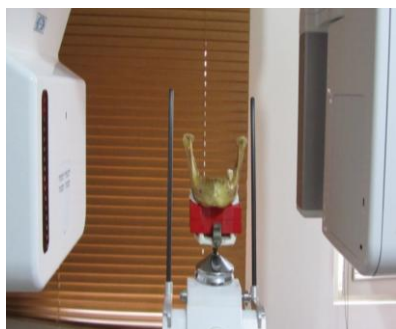
شکل ۱- تصویر مندیبل در حالت استاندارد (موازی افق)