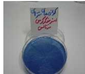
شکل ۱- کلنی‌های استرپتوکوک موتانس

تحقیق، روی ۱۵۰ کودک که ۷۱ نفر در گروه مورد با استرپتوکوک موتانس (بیش از 10^4 cfu) و ۷۹ نفر گروه شاهد آنها با میزان استرپتوکوک موتانس کمتر و مساوی 10^4 cfu، انجام شد. دو گروه از لحاظ عوامل مرتبط مشابه سازی شدند. (جدول ۱)