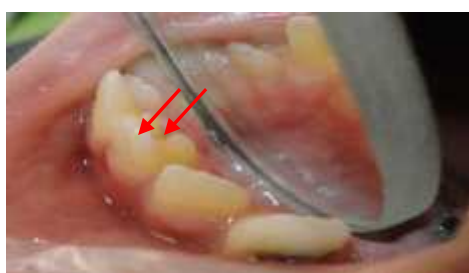
شکل ۲- نمای کلینیکی تالون کاسپ از سطح پروگزیمال

هیچ آنومالی مشابهی در خانواده‌ی کودک وجود نداشت. جهت بررسی وضعیت پالپ نسبت به کاسپ‌های تالون رادیوگرافی پری اپیکال از ناحیه تهیه شد و دو ساختار رادیو اپیک به شکل V معکوس در رادیوگرافی دیده شد. گسترش پالپی به داخل کاسپ تالون در رادیوگرافی قابل ردیابی نبود. (شکل ۳)