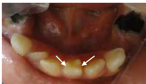
شکل ۱- نمای کلینیکی تالون کاسپ از بعد انسیزال

نصف این فاصله گسترش پیدا کرده باشد و ۳) Trace - talon سینگوم بسیار برجسته و مشخص داشته باشد. (۱،۲،۴)