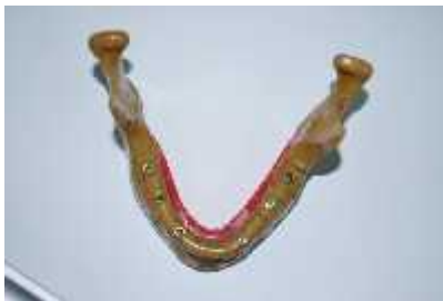
شکل ۱- Implant Drilling Model مورد استفاده در مطالعه

این مطالعه از نوع توصیفی بوده و به منظور انجام آن از مجموعه خشک انسان (dry skull) استفاده شد. (۱) از آنجاییکه هدف ما بررسی آرتیفکتهای ناشی از سخت شدن پرتو در ایمپلنتهای دندانی بدون تداخل با هیچ ماده دیگری بود، از Implant Drilling Model [IMP 1003-L-HD] ساخت ژاپن که کاملاً مشابه مندیبل واقعی انسان است به جای فک تحتانی استفاده شد. (شکل ۱)