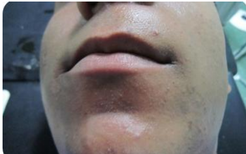
شکل ۱ - تورم منتشر در سمت چپ صورت که باعث محو شدن چین نازولیبیال شده است

صورت طبیعی بود و تغییر رنگی مشاهده نمی‌شد. ناحیه متورم هیچ افزایش دمای موضعی نداشت. در لمس گره‌های لنفی ناحیه هیچ گونه لنفادنوپاتی دیده نشد. بیمار همچنین سابقه‌ی تروما به این ناحیه را ذکر نکرد.