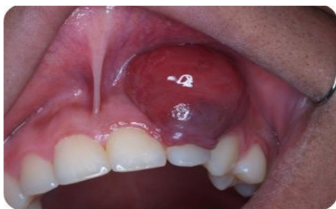
شکل ۲ - ضایعه اگزوفیتیک روی لثه که عرض لثه چسبنده را در بر گرفته و تا عمق وستیبول کشیده شده است

سطح ضایعه صاف و در لمس فاقد تموج بود و قوام آن لاستیکی بود. دندان سنترال، لترال، کانین چپ بالا دچار لقی درجه یک شده بودند و وایتالیتی تست نشان داد که دندان‌ها زنده هستند. رنگ ضایعه قرمز ارغوانی و در بعضی نواحی تمایل به کبودی داشت و با تحریک، دچار خونریزی می‌شد. ضایعه با علائم