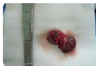
شکل ۴- ابعاد ضایعه پس از برداشت آن