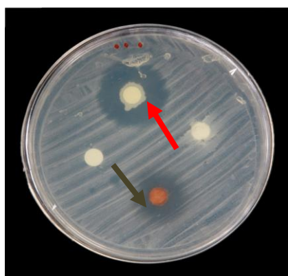
شکل ۳- مقایسه هاله‌ی عدم رشد دارچین (فلش سبز) با نیستاتین (فلش قرمز)

مربوط به عصاره ی آویشن به میزان (0.82 \pm 13) بود. آزمون ANOVA نشان داد که تفاوت در مهار کاندیدا از لحاظ آماری معنی‌دار بود. (P < 0.001)