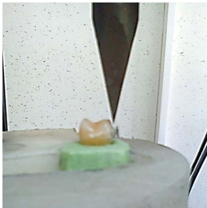
شکل ۱: محل اعمال نیرو با دستگاه Universal Testing Machine

۱ میلیمتر در دقیقه قرار گرفتند. محل اعمال نیرو در تمامی نمونه ها مطابق شکل ۱ روی لبه اکلوزالی بیس براکت بود.