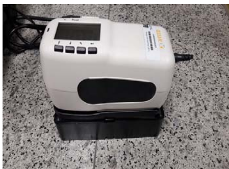
شکل ۳- دستگاه ترموسایکل

برای تهیه محلول چای در یک ظرف حاوی ۲۰۰ ml آب با دمای 100 °C یک عدد چای کیسه‌ای (گلستان محصول ایران) به مدت ۱ دقیقه قرار گرفت، سپس برای مشابه سازی با شرایط واقعی دمای محلول به ۵۵ °C مصرفی آن رسانده شد. هر روز محلول به صورت تازه تهیه شده و همه نمونه‌ها در مخزن مربوطه در دستگاه ترموسایکل (درسا، ساخت ایران) (شکل ۳) قرار گرفتند و به طور متناوب به مخزن حاوی آب مقطر با دمای ۳۷ درجه سانتی‌گراد منتقل شدند. بعد از هر بار غوطه‌وری در چای، نمونه‌ها جهت حذف هرگونه دبری شسته شدند. (۱۴)